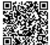
賛同登録用QRコード