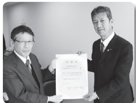
甲賀農業協同組合様へ感謝状の贈呈

上記の皆様から頂いた、寄附金ならびに資材については当財団が実施いたします、環境保全に関する公益目的事業において有効に活用させていただくこととしています。