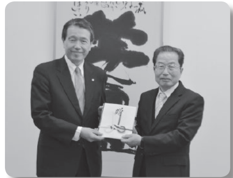
関西アーバン銀行様より目録の贈呈

関西アーバン銀行様は、エコライフ定期預金など環境配慮型定期預金の10月末現在の残高の0.005%に当たる金額を、県内の環境保全のために役立てて欲しいとして、毎年ご寄附をいただいています。